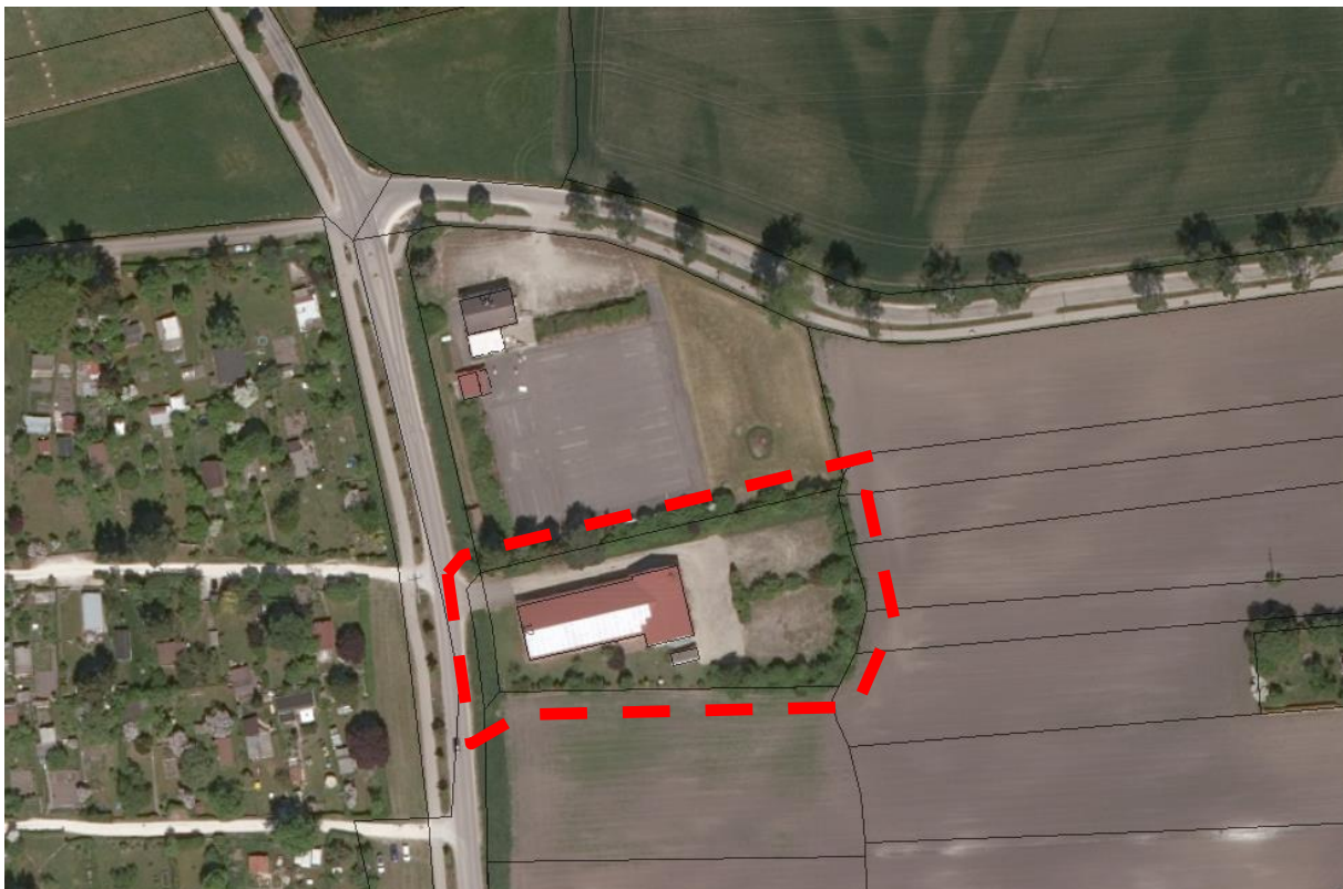
Auszug Geodaten online – ohne Maßstab Rot: Änderungsbereich